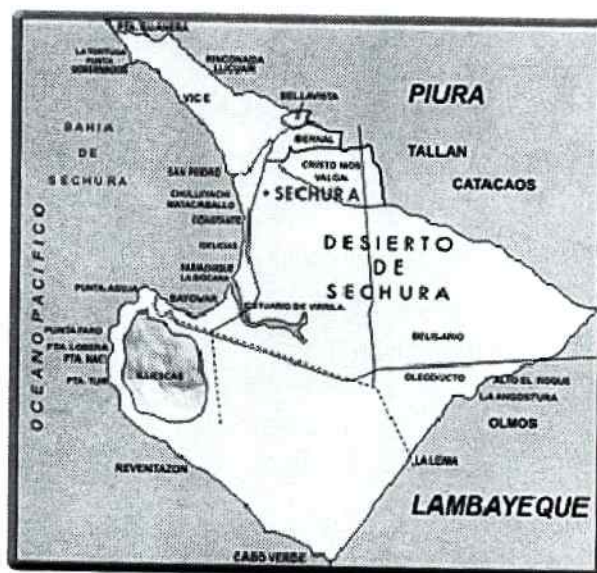
MAPA DE LA PROVINCIA DE SECHURA