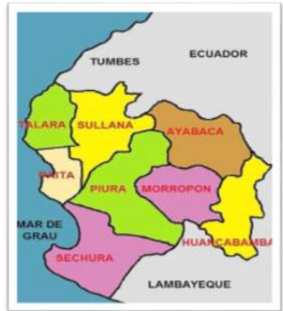
Figura 1: Mapa del departamento de Piura