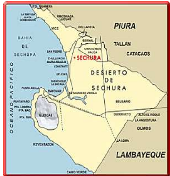
Figura 2: Mapa de la provincia de Sechura

Sechura como Distrito fue creado el 21/06/1825, en el gobierno de Simón Bolívar. Jurisdicción actualizada y/o perteneciente desde el 29/01/1994 a la Provincia de Sechura.